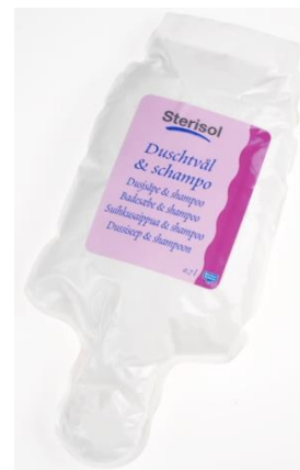
Ilman säilöntäaineita Käytettävä annostelijassa

Yleisesti käytettävä pumppupullo sisältää 33 grammaa. Katso myös alta.