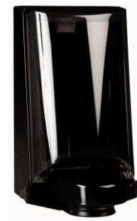
Musta Tuotenro. 3552