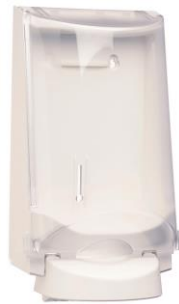
Valkoinen Tuotenro. 3551