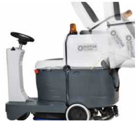
Kallistuva likavesisäiliö helpottaa akkutilaan ja Ecoflex-järjestelmään pääsyä.