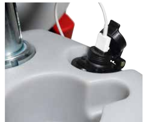
USB-liitännän saa lisävarusteena.