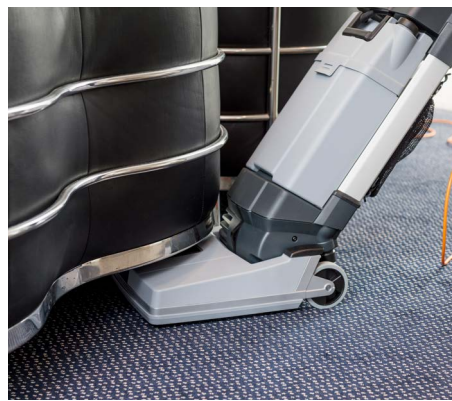
Vapaa korkeus puhdistettaessa on vain 25 cm.