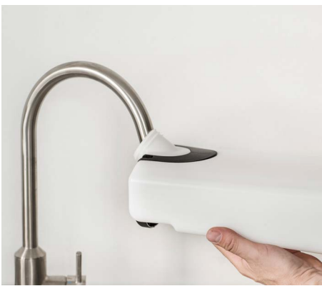
Puhdasvesisäiliö on helppo täyttää tavallisella vesihannalla.