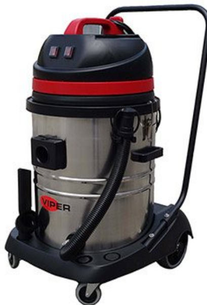
Malli on voitu esittää kuvissa lisävarustein

VIPER LSU135 on märkä/kuivaimuri ammattikäyttöön. Se on helpokäyttöinen, kestävä, suurella imuteholla.